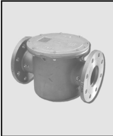
ОБЩИЕ РАЗМЕРЫ (мм)